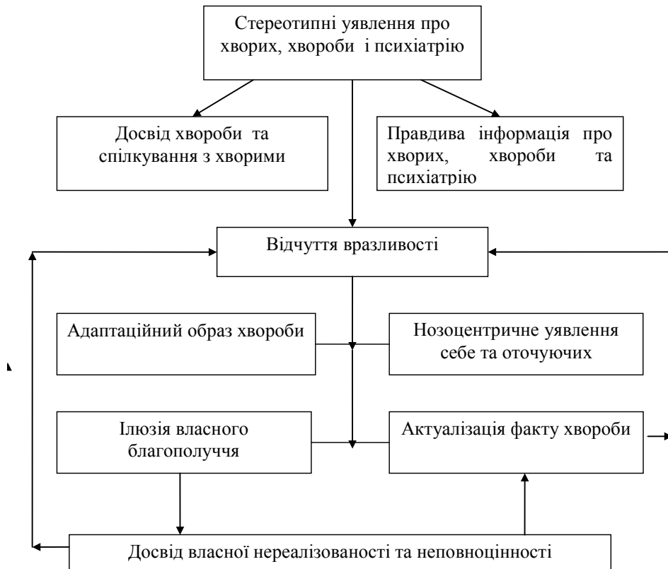
Рисунок 2. Структурно – динамічна модель самостигматизації

зору даної моделі, самостигматизація являється специфічною адаптаційною стратегією і функціонує за принципом «замкнутого кола», що в свою чергу обумовлює її резистентність до певних дестигматизаційних заходів. Ключовою ланкою, що визначає мотивацію до самостигматизації – є вразливість. Поряд з переживаннями, що обумовлені хворобою та структурою особистості, воно може містити різні аспекти, які знаходяться за межами сфери психічного здоров'я (наприклад, пов'язане з віком, соціальним статусом чи особливостями життєвого досвіду психічно хворого) [4]. Специфіка функціонування даної моделі зображена графічно на рис. 2.